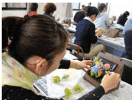
プリザーブドフラワー教室 平成28年4月24日(日) 新博多町交流センター2階