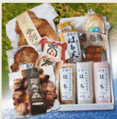
《なかつ燐燐市場》取扱商品 希望小売価格:5,400円

ハモかまぼこ 耶馬のハムセットは、おつまみ用に。 急なお客様のときやお弁当のおかずにもどうぞ!!