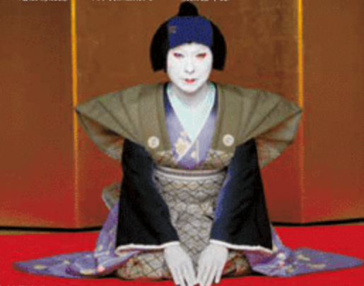
中村芝雀改め 中村雀右衛門