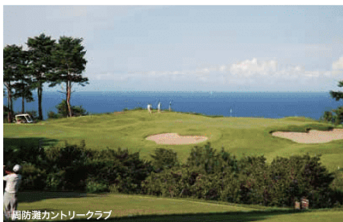
周防灘カントリークラブ