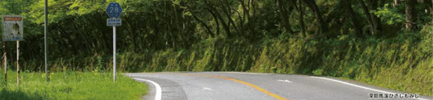
深耶馬溪ひさしもみじ