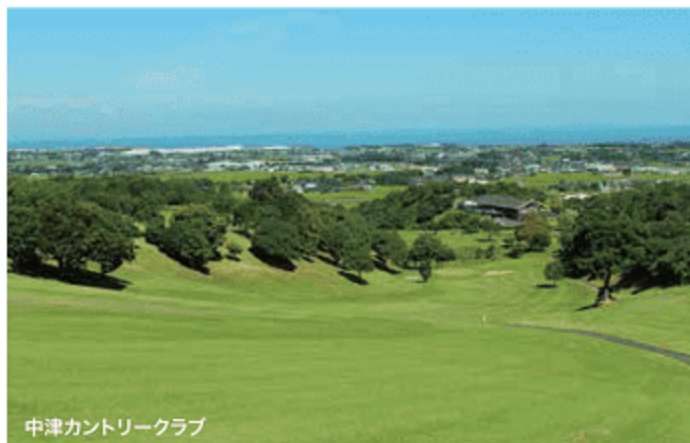
中津カントリークラブ