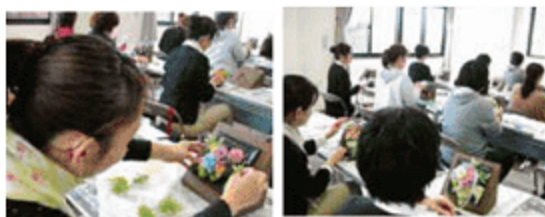
昨年度の教室風景です