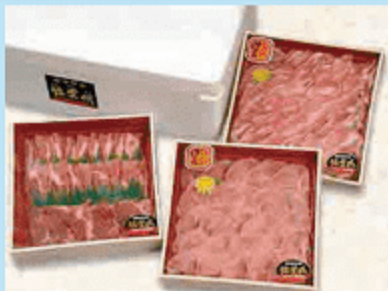
●ロース肉:400g ●バラ肉:400g ●肩ロース肉:200g