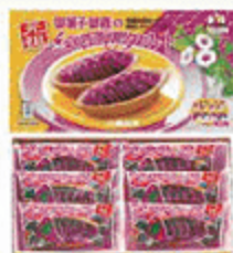
紅芋タルト(6個入り)