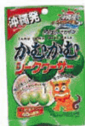
かむかむ シークワサー

※応募ハガキは1会員1枚とし、重複応募は抽選対象外といたします。 ※当選者には3月11日(月)以降に連絡し、6・7月号で発表いたします。 ※ハガキの表に必ず差出人(会員)の住所・氏名をご記入ください。また①~④の必要事項に記入漏れが無いようにご注意ください。