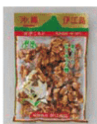
伊江島ピーナッツ糖