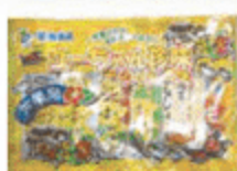
ユーちゃん珍味アソート