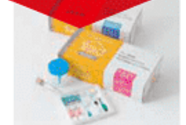
おうちでドック(男性用と女性用)のキットイメージ

おうちでドック (男性用と女性用) 通常価格19,800円(税別) 会員価格(男女各) 18,000円(税別)