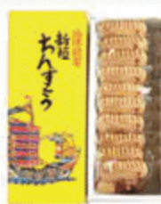
新垣ちゃんすこう