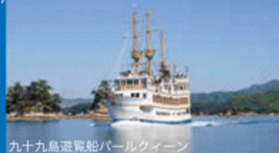
九十九島遊覧船パールクイーン

会員料金にてパールクイーンまたはみらいを ご利用いただけます。出航予定時刻につま しては、九十九島パールシーリゾートの公式 サイトをご覧ください。 pearlsea.jp/