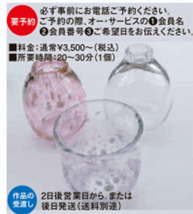
作品の受渡し 2日後営業日から、または後日発送(送料別途)

③ Café BoiBoi 竹田市久住町久住4050-23 くじゅう花公園横 ☎0974-76-0333 [営]10:00~18:00 [休]木曜日 [駐]駐車場完備 お食事 500円引 ※1人500円(税込)以上の注文時に限る。 下記のクーポンと会員証をご提示ください。