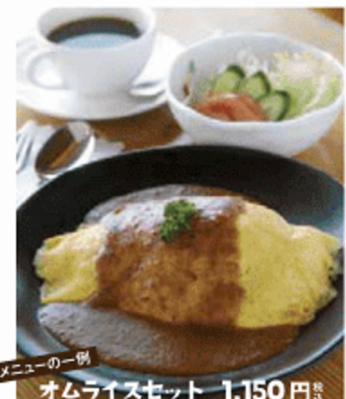
メニューの一例 オムライスセット 1,150円

③ Café BoiBoi 竹田市久住町久住4050-23 くじゅう花公園横 ☎0974-76-0333 [営]10:00~18:00 [休]木曜日 [駐]駐車場完備 お食事 500円引 ※1人500円(税込)以上の注文時に限る。 下記のクーポンと会員証をご提示ください。