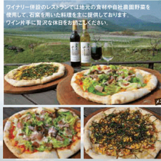
ワイナリー併設のレストランでは地元の食材や自社農園野菜を使用して、右案を用いた料理を主に提供しております。ワイン片手に賢達な休日をお過ごしください。

④ 吹きガラス工房 マグマガラススタジオ 竹田市久住町久住3987久住さやか内 ☎0974-76-1878 [営]10:00~17:00 [休]火曜日 [駐]駐車場完備 吹きガラス体験 1,000円引 ※大人(高校生以上)に限る 下記のクーポンと会員証をご提示ください。