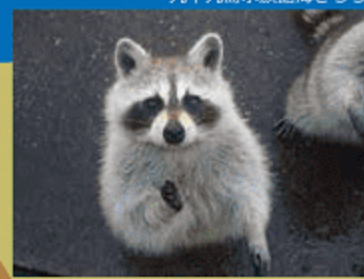
九十九島水族館海きらら