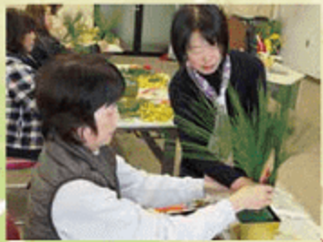
宇佐会場 ※写真は昨年のものです。

※裏面は応募方法をご覧 のうえご記入ください。 ※記入もれの無いように ご注意ください。