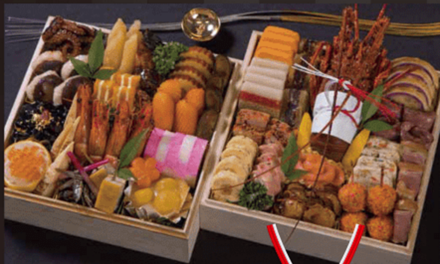
※写真は昨年のホテル特製二段重20,000円(税込)です。

GRAND PLAZA NAKATSU HOTEL ※通常価格でのチケットはグランプラザ中津ホテル(☎0979-24-7111)でご購入いただけます。