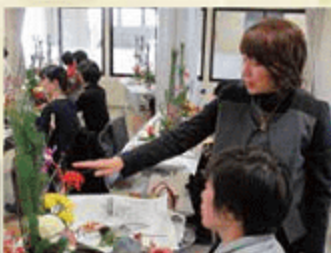
中津会場 ※写真は昨年のものです。