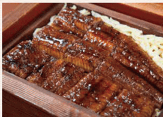
うなぎ・川魚料理 いた屋本家