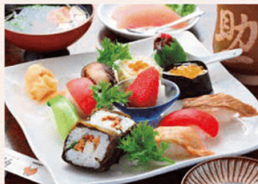
彌助すし 本庄町店

大分県日田市隈2-1-12 ☎0973-23-5646 [営]12:00~14:00 17:30~23:00 (お昼の営業は要予約) [休]不定休