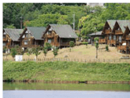
大池公園ふれあいの里ログハウス 湯の追温泉・大平楽 ログハウス 上毛町下唐原2335-1