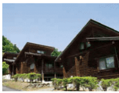
西谷温泉ログハウス 中津市本郷馬漢町西谷1448