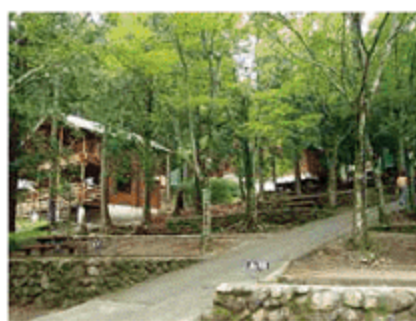
語らいの森求菩提キャンプ場 豊前市大字鳥井畑247-3

※同じ1棟に会員が2名以上宿泊する場合も1会員分(3,000円)のみの補助とします。(1棟に使える利用券は1枚です。) ※有効期間を過ぎた利用券は無効となります