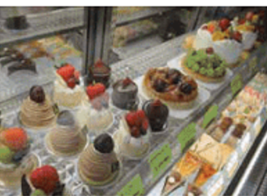
ピノキオ 中津市島田本町26 ☎0979-24-5524 [営]11:00~22:00 [休]水曜日