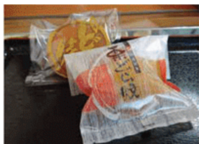
利休堂 中津市天神町2番地 ☎0979-22-0246 [営]平日9:00~19:00 日曜日~16:00まで [休]水曜日・1/1~1/3