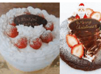
工房よしかわ 築上郡築上町小原1232-2 ☎0930-56-3477 [営]10:00~18:00 [休]火曜日・年末年始(お問合せ)