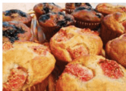
オーガニック café ciel (シエル) 中津市三光田口84番地3 ☎090-6779-0280 [営]11:00~15:00 [休]日曜日・月曜日(祝日は営業)・不定休