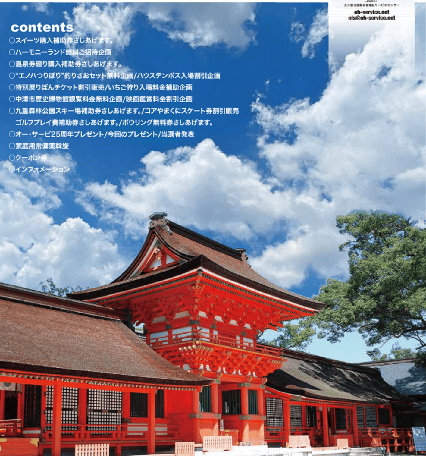
八幡総本宮、宇佐神宮(宇佐市)