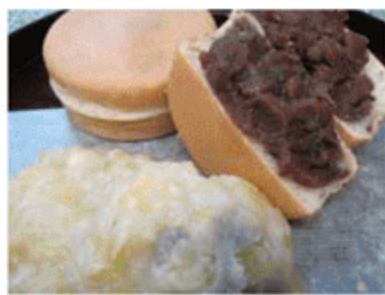
佐伯屋 中津市大字島田224-6 ☎0979-22-0800 [営]9:00~19:00 [休]不定休