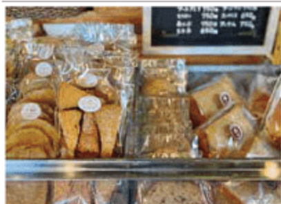
ナチュラルレストラン 風の音 大分県中津市高通679-5 ☎0979-23-5818 [営]9:30~17:00 [休]月曜日