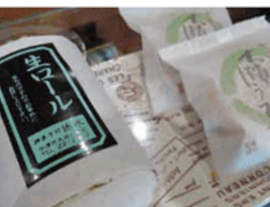
菓子処 徳永 中津市大貞342 ☎0979-22-2302 [営]8:00~19:00 [休]水曜日