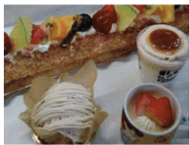
石窯工房 魔法の樹 中津市大貞354-4 ☎0979-32-5636 [営]7:00~19:00(休)無休 福沢通り店も可 9:00 ~ 19:00