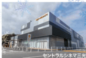
セントラルシネマ三光