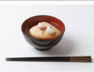
武蔵屋総本店 中津市牛神424-4 ☎0979-22-1191 [営]9:00~18:30 [休]不定休