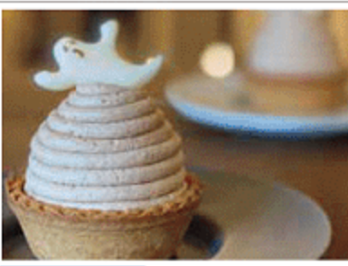
お菓子のかねい 中津市上宮永2丁目71-12 ☎0979-22-0815 [営]8:00~17:00 [休]日曜日・第4月曜日 (お節句時期、年末年始は変わることがあります)