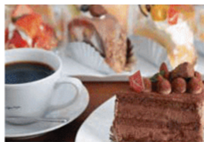
たまごキッチン ママン 中津市中央町2-4-5 ☎0979-23-8844 [営]9:00~18:00 [休]火曜日